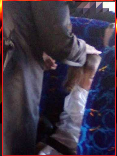
אחרי 9 שעות נסיעה והמתנה - עושים חאלאקע על האוטובוס...