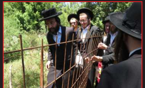
מעצר על אם הדרך