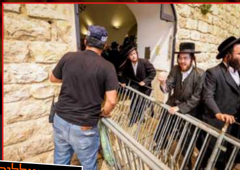
ההתעללות במחסומים והפריצה של האלפים