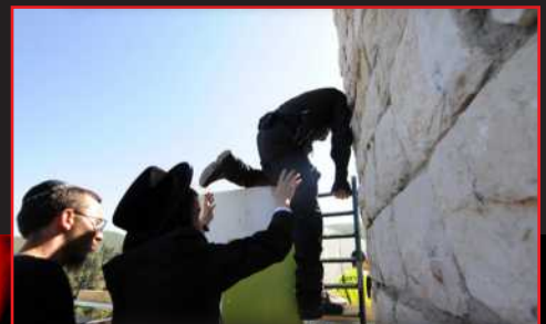
מתפללים עוזרים לחלץ עם סולמות שוטרים מבוהלים....