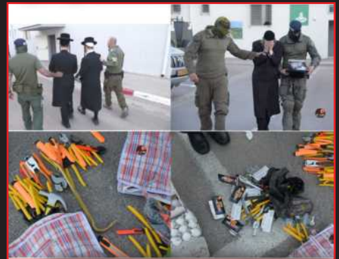
התעמולה של המשטרה על תפיסת כלים חדים...