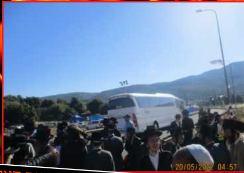
מייבשים את האלפים בחניונים