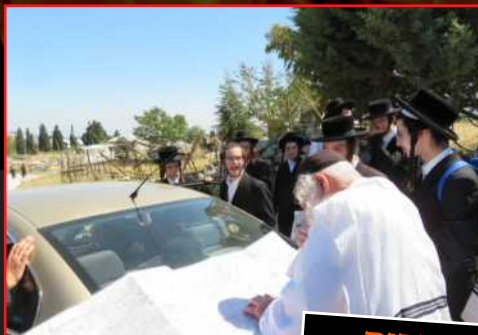
מציינים את הדרכים