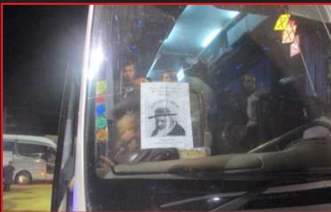
אחד האוטובוסים הכשרים...