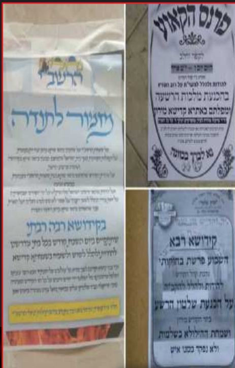
שמחה רבה וקידושא רבא...