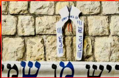
בשער הציון - הכרטיס שלי לרשב"י

האמת, אחרי ההלם הראשון מהאסון הנורא בל"ג בעומר תשפ"א, כבר הבנו את אשר לפנינו. היה ברור כי הציונים המשתלטים יקפצו על המציאה וינסו לנצל את האסון הנורא בכל דרך ציני ומרושע למען מטרתם הישנה שהיא ההפקעה וההשתלטות על הר הקודש מירון. משכך החיישנים החלו לפעול, ולעקוב אחר כל צעד בענין, כאשר ההבנה היתה ברורה, כי אסור שהרגשות המכבידות של האסון הנורא והמחריד ישמשו כ'כרטיס כניסה' על מגש של זהב לאותם רשעים הזוממים להשתלט על כל הקדוש והיקר לנו. את התהליך כולם מכירים. כל 'ערי התקשורת' יצאו בקריאות שחייבים 'ועדת חקירה', וזו אכן הוקמה, כאשר במהלך כמה חודשים שמעה המון עדויות מהשטח, כאשר הכל כבר הבינו לאן זה מוביל, ואת אשר יגורנו