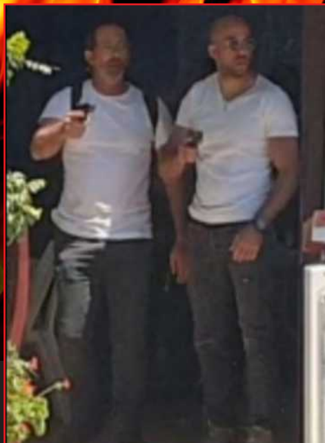
הבלשים עם נשק שלוף