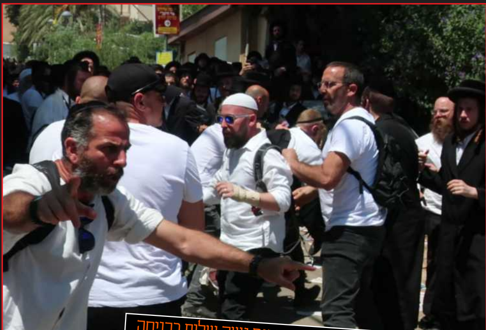
בלשים מחופשים נם נשק שלוף בכניסה לביהמ"ד קארלסבורג במירון